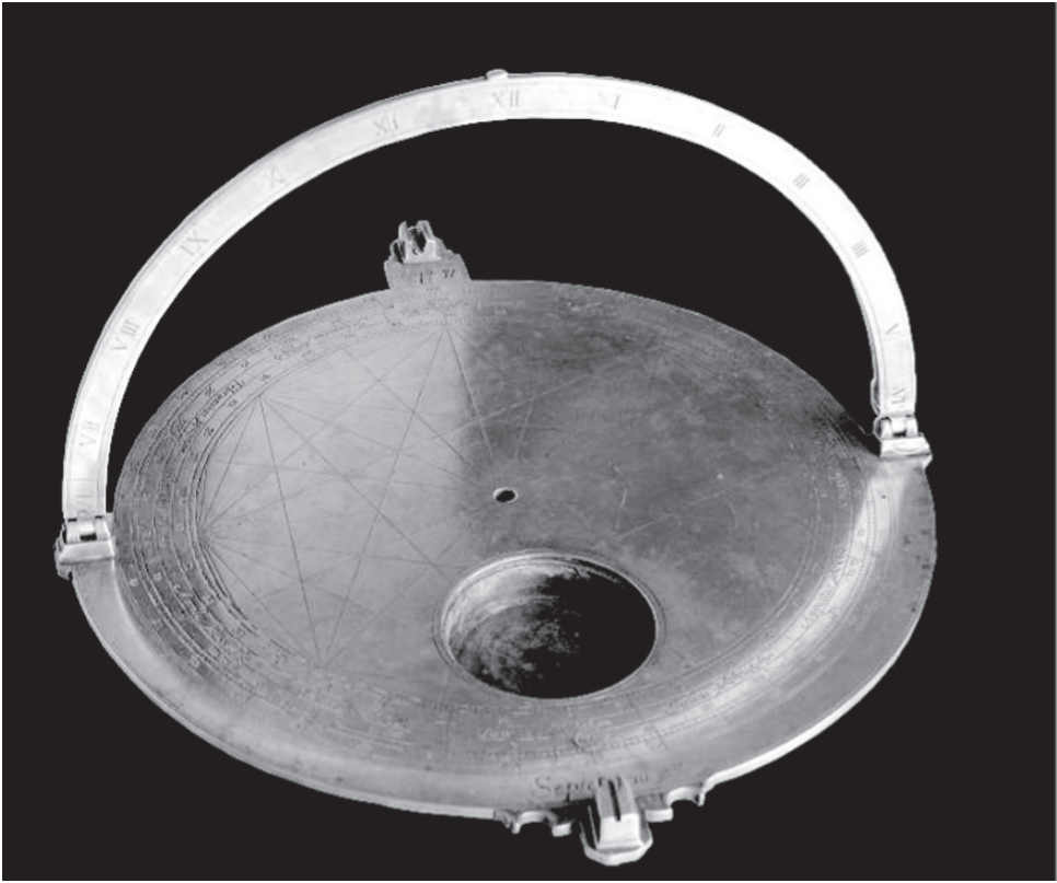
Fig. 1: Coignets halve zeesfeer.

uitgeklapt is, bedraagt de hoogte 10,8 cm. Op de grondplaat zijn vier voetjes bevestigd, waarop de zeesfeer kan staan. Er is een uitsparing voorzien waarin een kompas kan worden geplaatst. Op die manier kan de zeesfeer langs de noord-zuid as gericht worden. In het midden is een gaatje van ongeveer 3,5 mm, met aan de onderzijde een kleine versterking. Hierin moest de rotatie-as van één van de ontbrekende halve cirkels komen. Langs de oost-west as is in de scharnieren aan beide zijden een halve boog gemonteerd. Op deze boog staat de uurverdeling