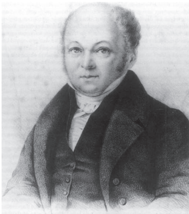
Fig. 5: Willem Frederik Büchner (1780–1855).

van stank. In Gouda werden onder andere beperkingen opgelegd aan de tijden en plaatsen waarop vuilnis en mest op straat mochten blijven liggen; er waren zelfs plaatsen waar mesthopen zonder meer verboden waren. Deze beperkingen dateren uit het eind van de vijftiende eeuw. In de zestiende eeuw echter werd over mesthopen niet meer gesproken en werd toegestaan dat toiletten rechtstreeks konden lozen op openbaar water, c.q. de grachten. 52