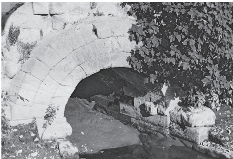
Fig. 1: De uitmonding van de Cloaca Maxima in de Tiber te Rome

Gaandeweg nam in de Grieks-Romeinse wereld het gebruik van beerputten af en gingen men over tot de aanleg van vaste toiletten. Waar mogelijk, werden deze toiletten aangesloten op dit riool, maar dit kon alleen op plaatsen waar riolen voorhanden waren. In Rome werden po's gelegegd door de inhoud uit het raam te werpen. 12 Openbare toiletten en badgebouwen hadden gewoonlijk wel een aansluiting op het riool. Aan het einde van de oudheid waren er in Rome 144 openbare toiletten. 13