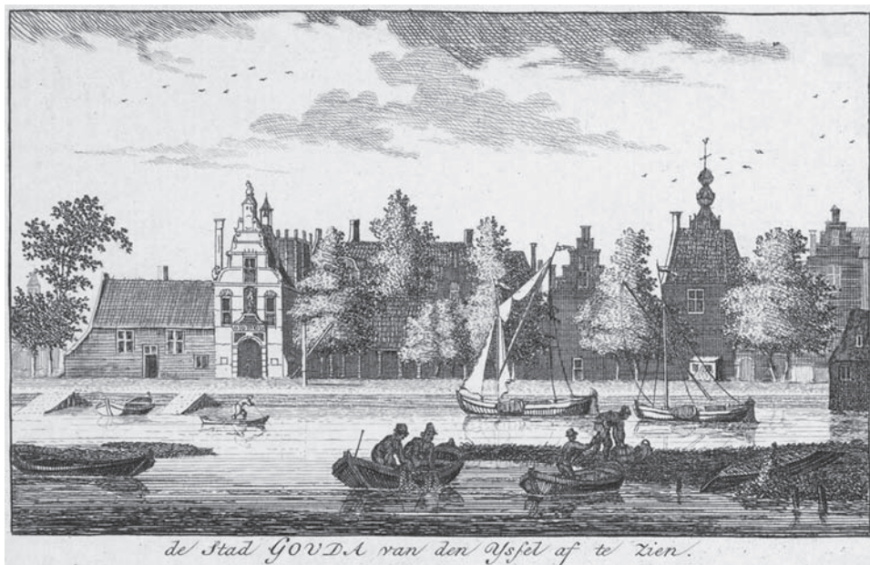
Fig. 6: Gouda gezien vanaf de IJssel. Links van de poort staat de Kleine Volmolen. Het peil van de IJssel was hoog genoeg om bij inlaat deze waterradmolens in de Gouwe aan te drijven.

oorzaak, dat bijna alle onreinheid, de afval van slagterijen, looijereijen, enz. in de grachten en in de waterleidingen worden uitgestort. 54