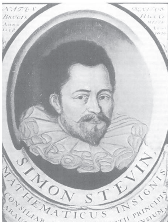
Fig. 3: Simon Stevin (1548–1620).

beste wijze, te weten een overwelfde ... [zie bovenstaand citaat]. Met dese overwelfde waterloopen en heeftmen niet sulcke verstopping, vergaring van slijck op de straten noch stanck gelijk met d'ander. 32